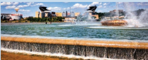
El parque estatal de Punto/Point State Park, condado de Allegheny

Aguas bravas= hay oportunidades de remar en aguas bravas aquí