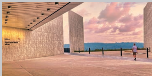
El monumento nacional de Vuelo 93, condado de Somerset