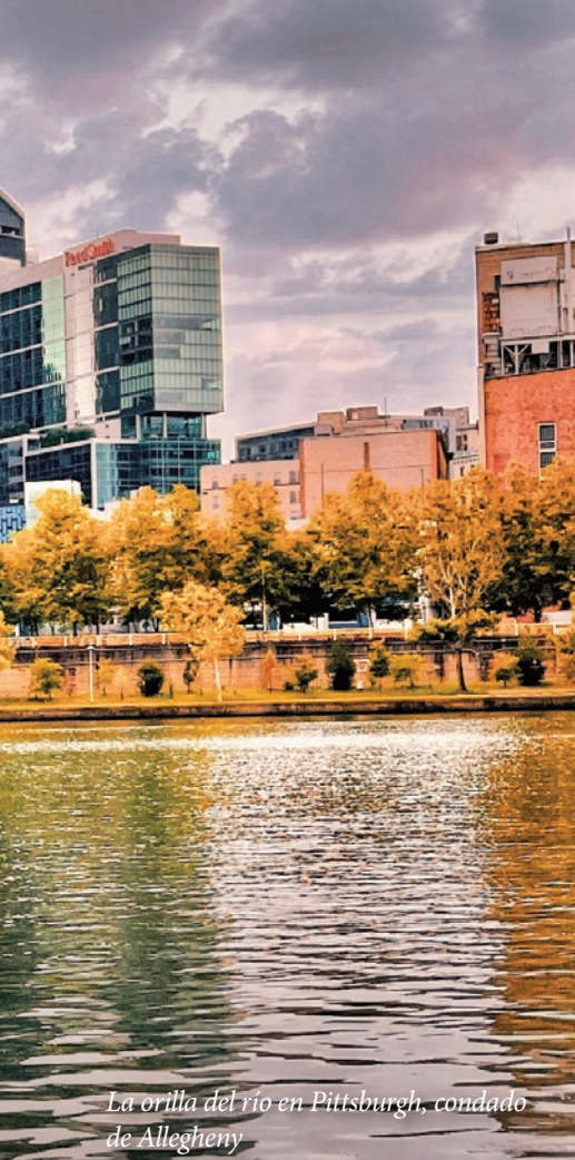
La orilla del río en Pittsburgh, condado de Allegheny