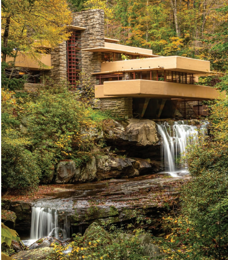
Fallingwater (Agua Cayendo), condado de Fayette