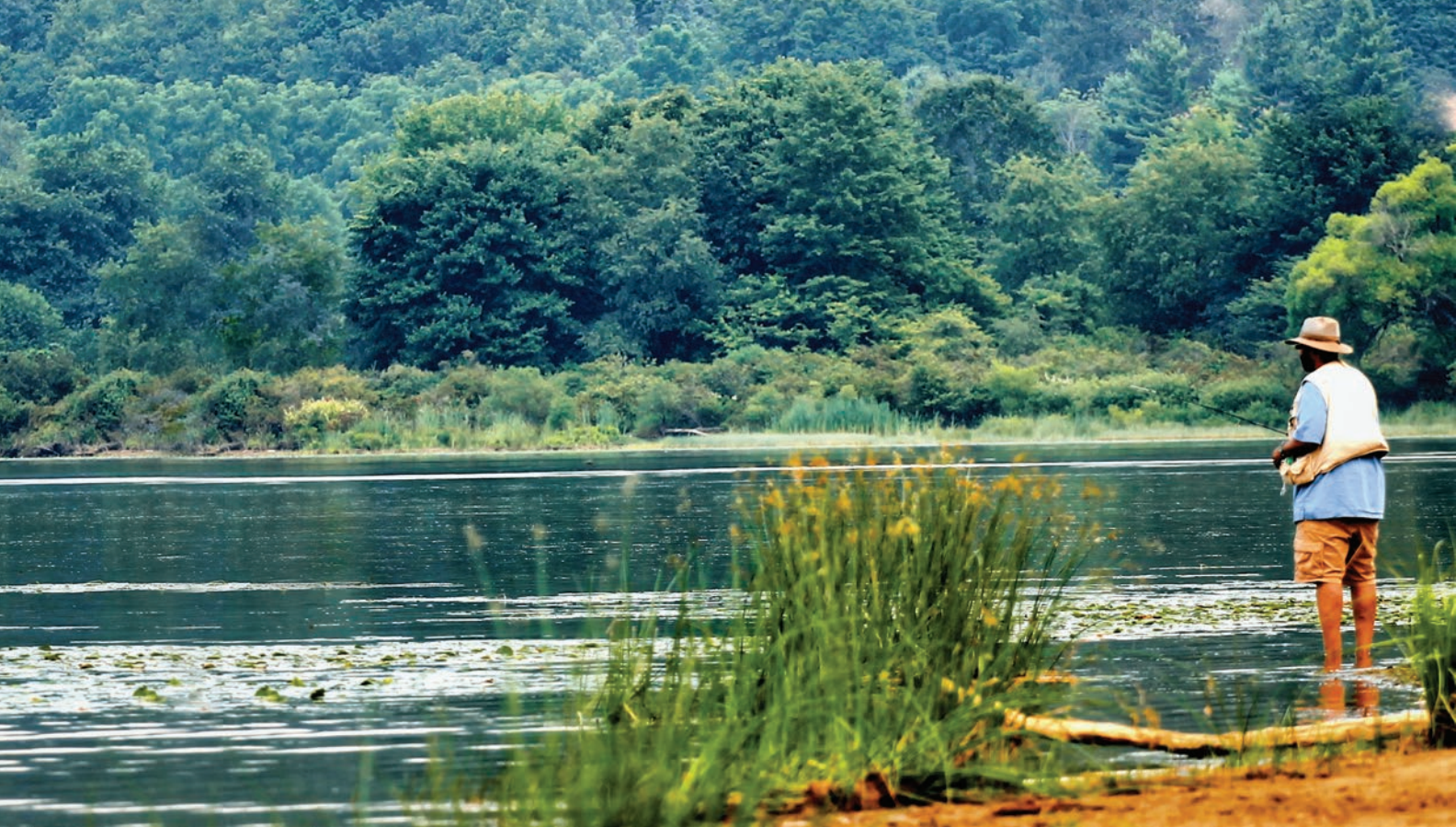
l parque estatal de Yellow Creek (Arroyo Amarillo), condado de Indiana