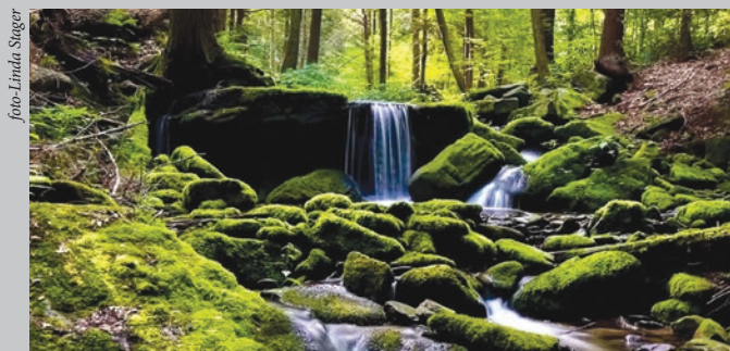
Las cascadas acerca del parque estatal de Cadena de Laurel/ Laurel Ridge, los condados de Cambria, Fayette, y Somerset

Tres Ríos: Los ríos Allegheny, Monongahela, y Ohio son los mejores lo que conocen en Pittsburgh, pero otra vía fluvial en la región es el río Youghiogheny. Este sistema incluye el parque estatal de Ohiopyle, renombrado por sus oportunidades del descenso de aguas bravas y aventuras en el aire libre. También es una parte del GAP. El “Yough,” su nombre local, esculpe un desfiladero dramático de 14 millas en el parque estatal de Ohiopyle y es un imán por los fanáticos