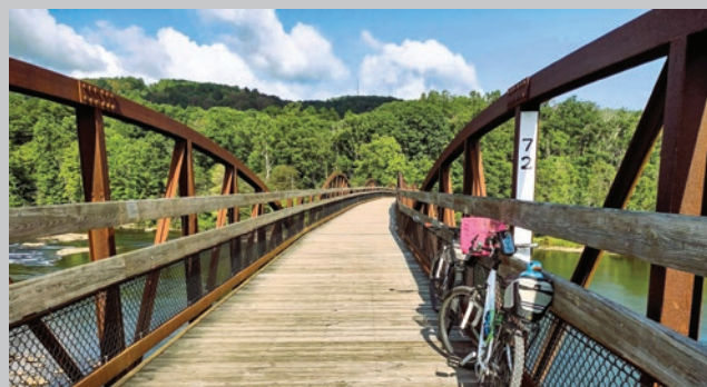
El río Casselman, condado de Somerset