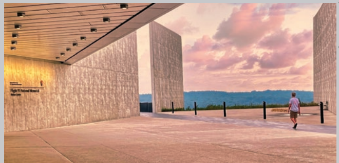
El monumento nacional de Vuelo 93, condado de Somerset