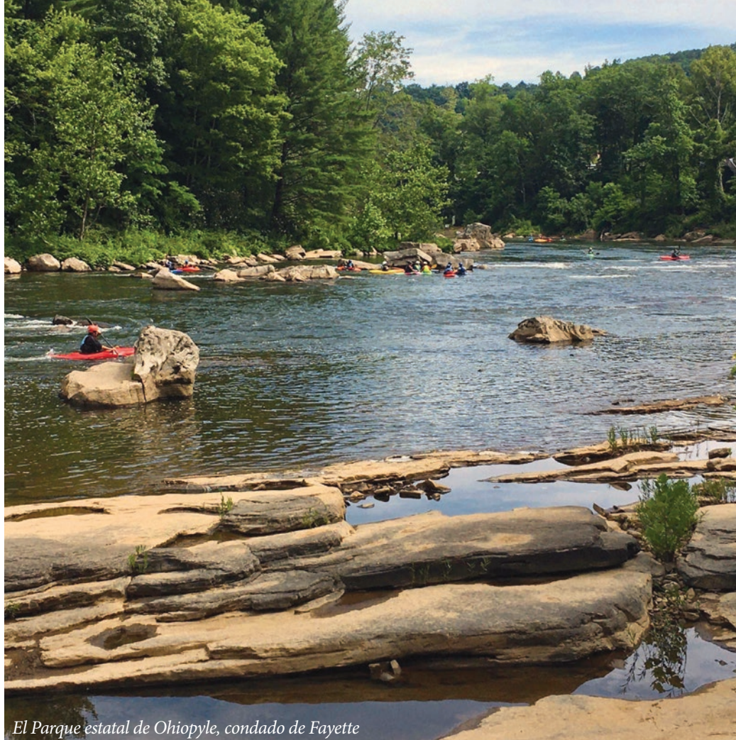
El Parque estatal de Ohiopyle, condado de Fayette