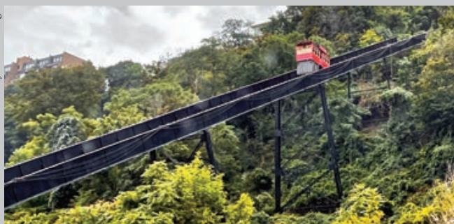
La Pendiente de Dusquesne, condado de Allegheny