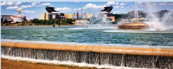
El parque estatal de Punto/Point State Park, condado de Allegheny

Aguas bravas= hay oportunidades de remar en aguas bravas aquí