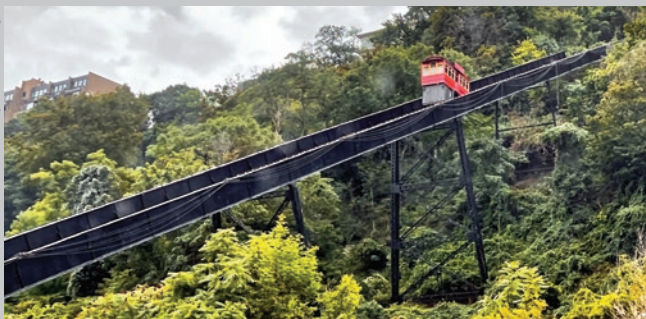
La Pendiente de Dusquesne, condado de Allegheny